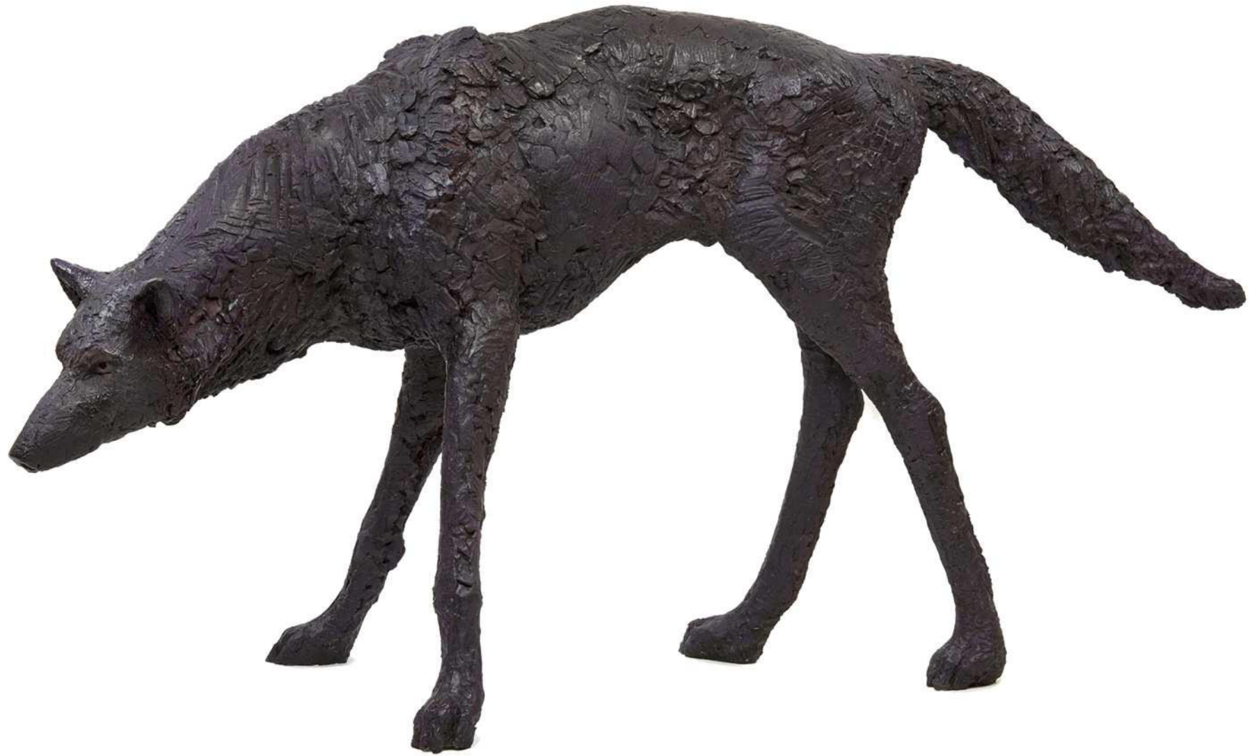
Wolf 1, 2019 Kunstharz bemalt 143 / 50 / 78 cm