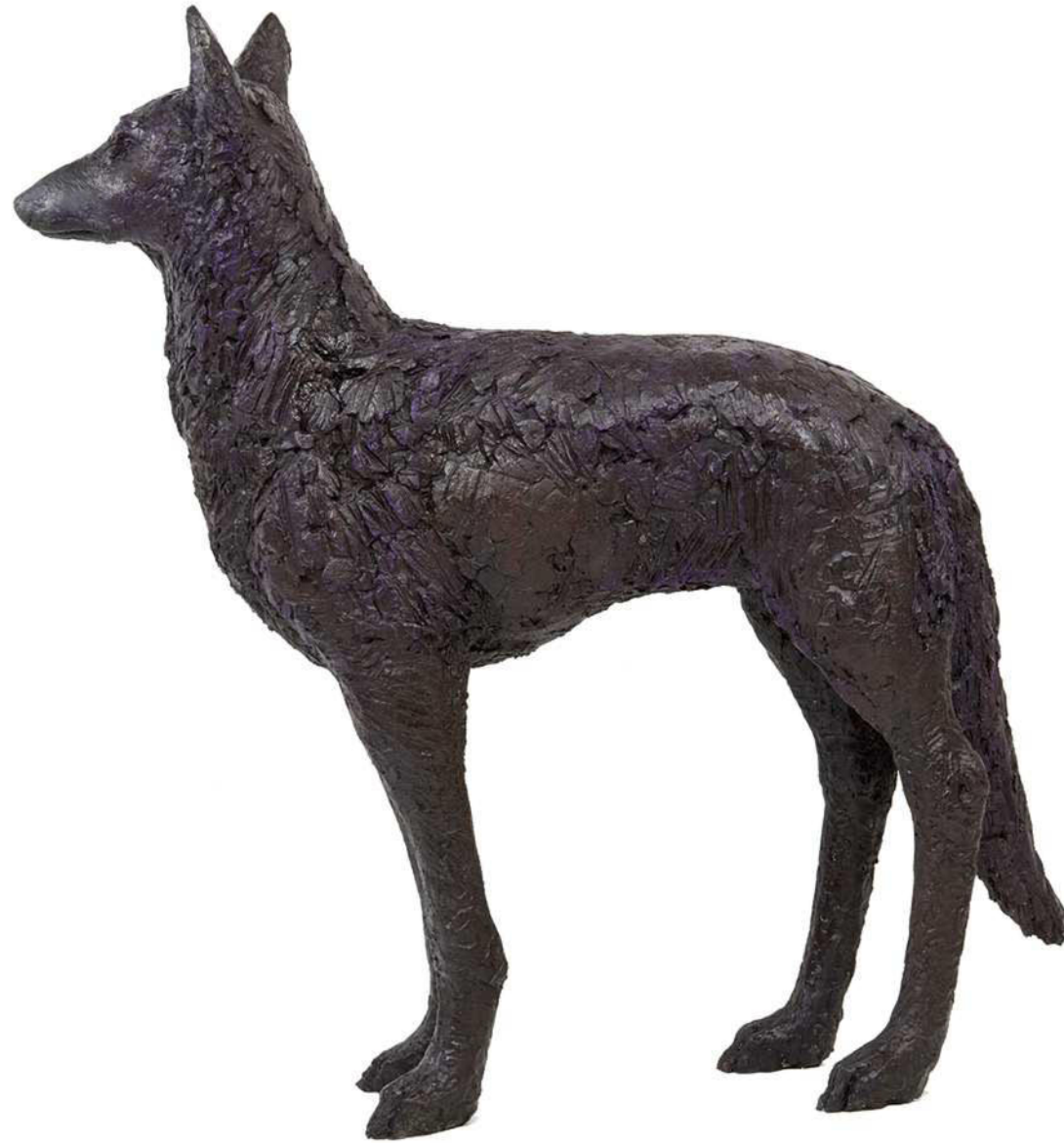
Wolf 2, 2019 Kunstharz bemalt 93 / 25 / 110 cm