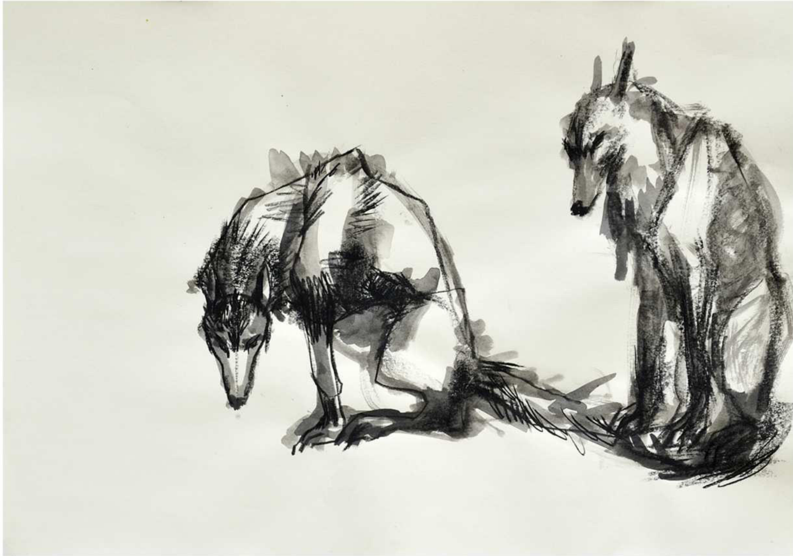
ohne Titel, 2019 Mischtechnik auf Papier 50 / 70 cm