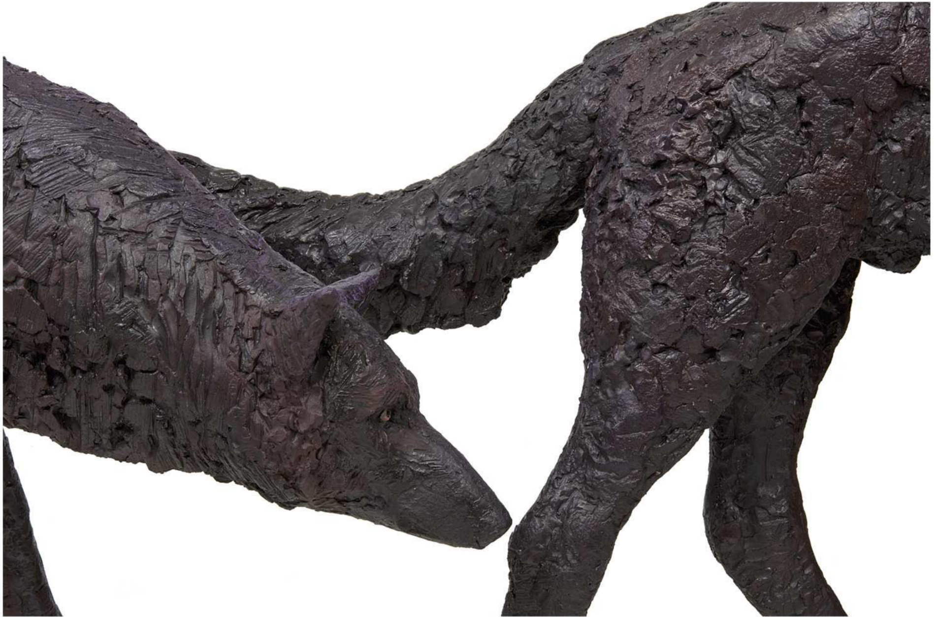
Wolf 1 und Wolf 3