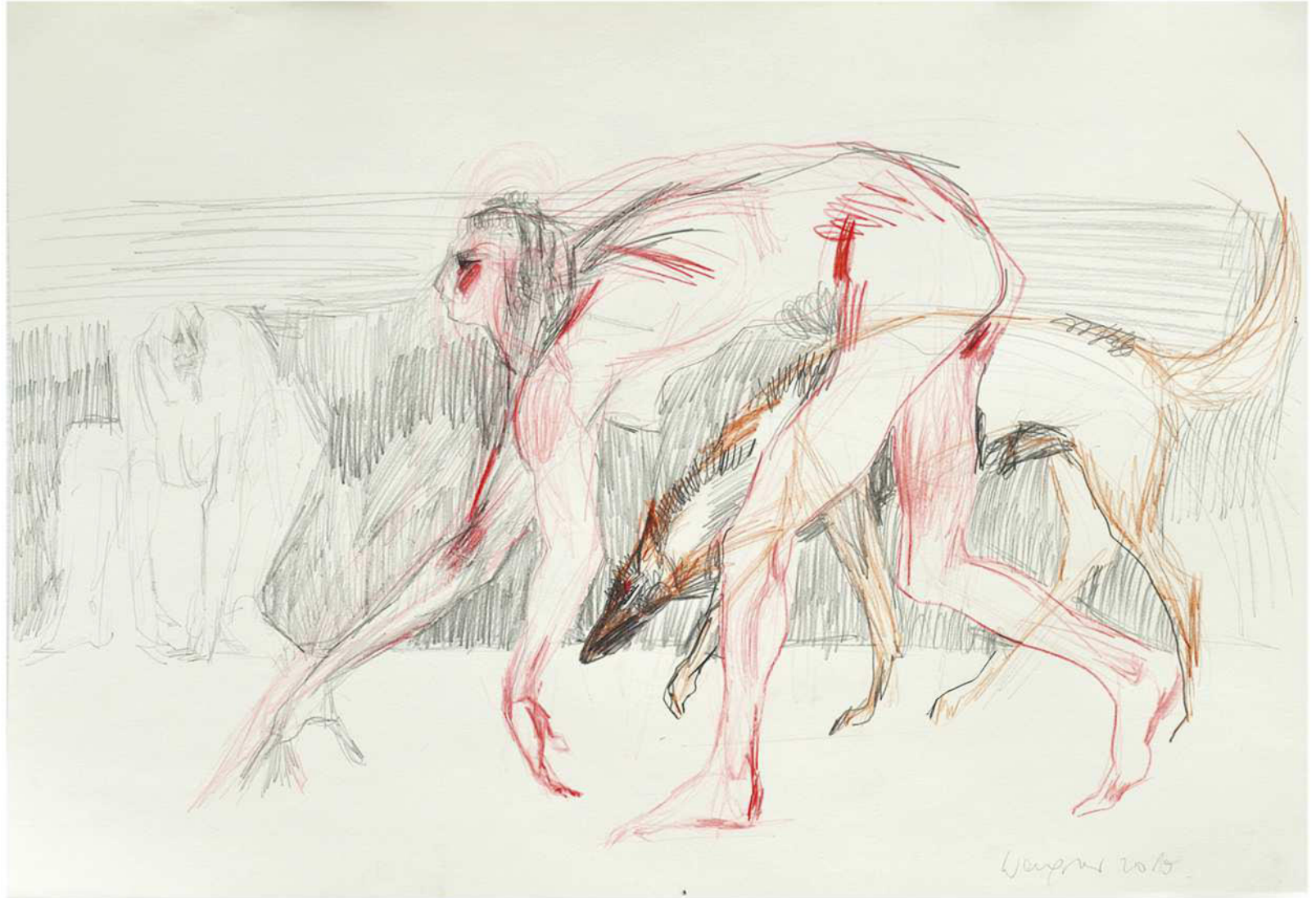
ohne Titel, 2019 Mischtechnik auf Papier 50 / 70 cm