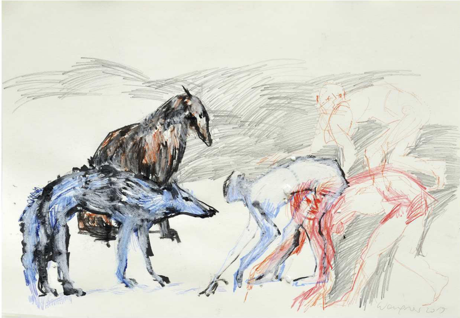
ohne Titel, 2019 Mischtechnik auf Papier 50 / 70 cm