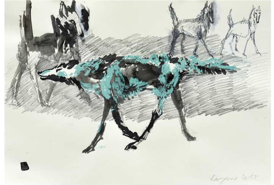
ohne Titel, 2019 Mischtechnik auf Papier 50 / 70 cm