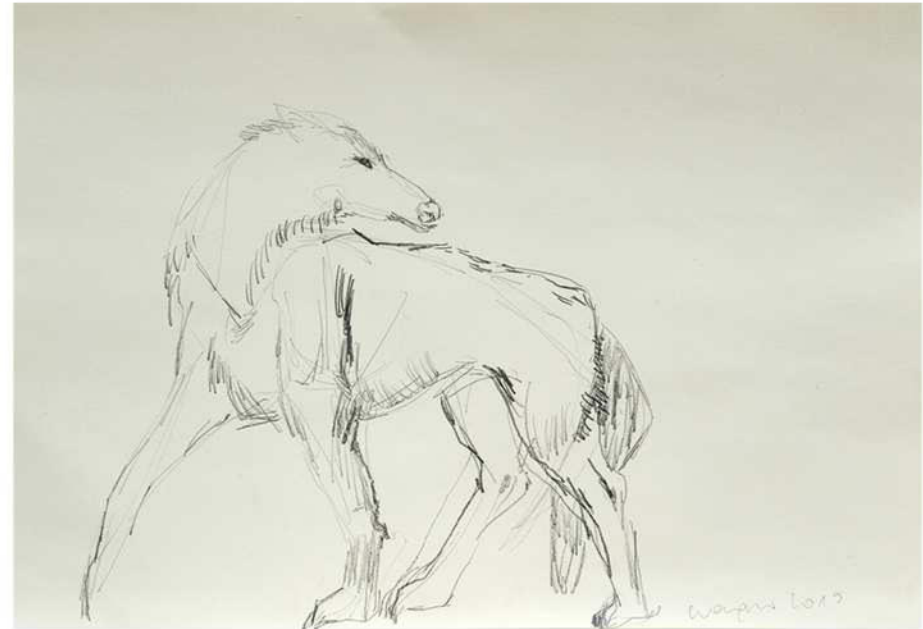
ohne Titel, 2019 Bleistift auf Papier 50 / 70 cm