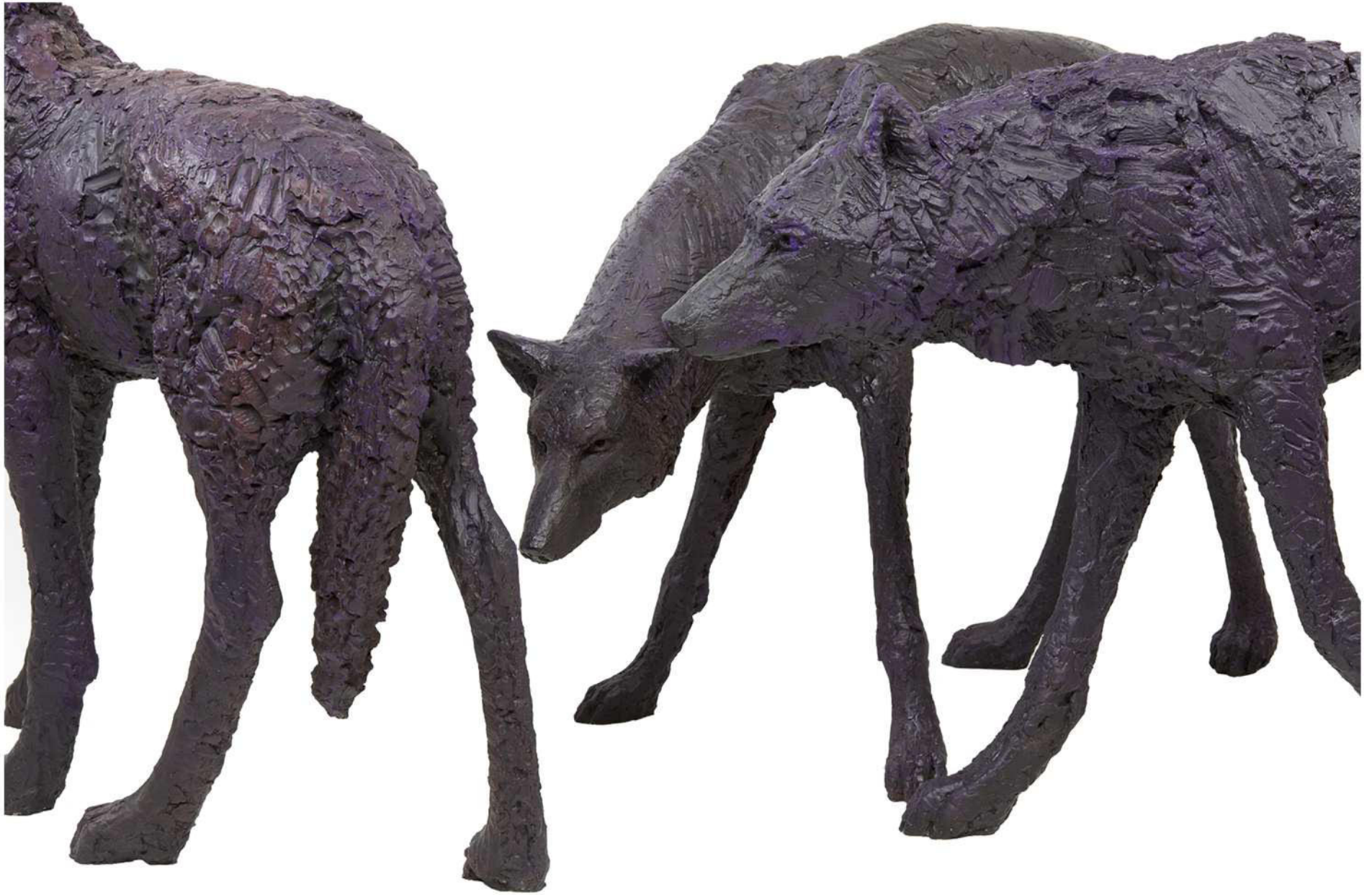
Wolf 1, Wolf 4 und Wolf 5