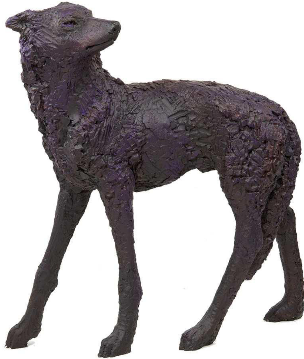
Wolf 4, 2020 Kunstharz bemalt 93 / 42 / 101 cm