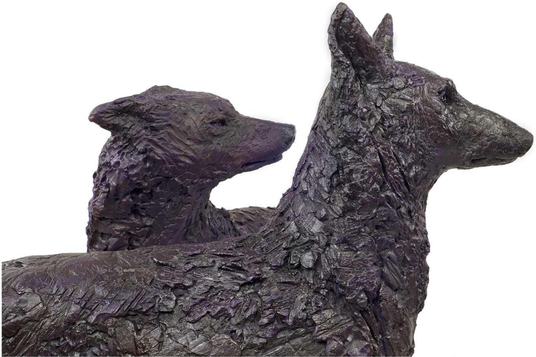
Wolf 2 und Wolf 4