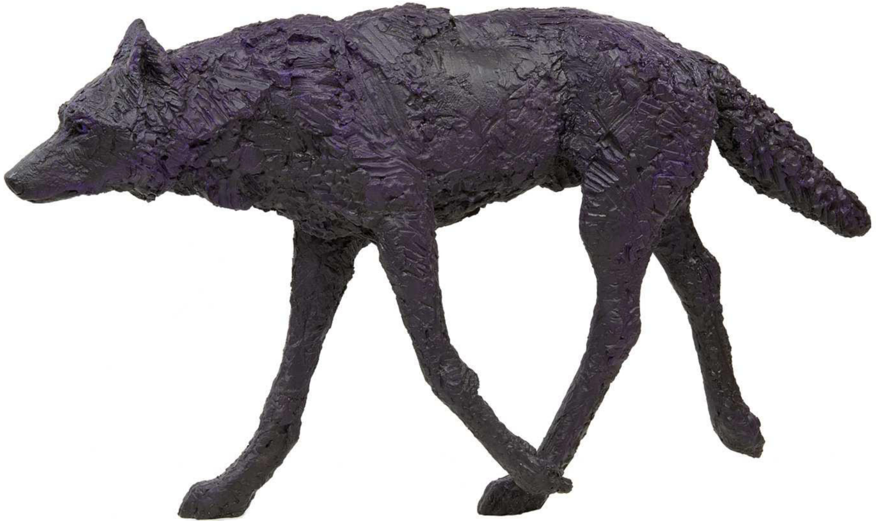
Wolf 5, 2020 Kunstharz bemalt 146 / 27 / 80 cm