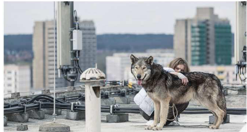
Filmstill aus WILD, Nicolette Krebitz