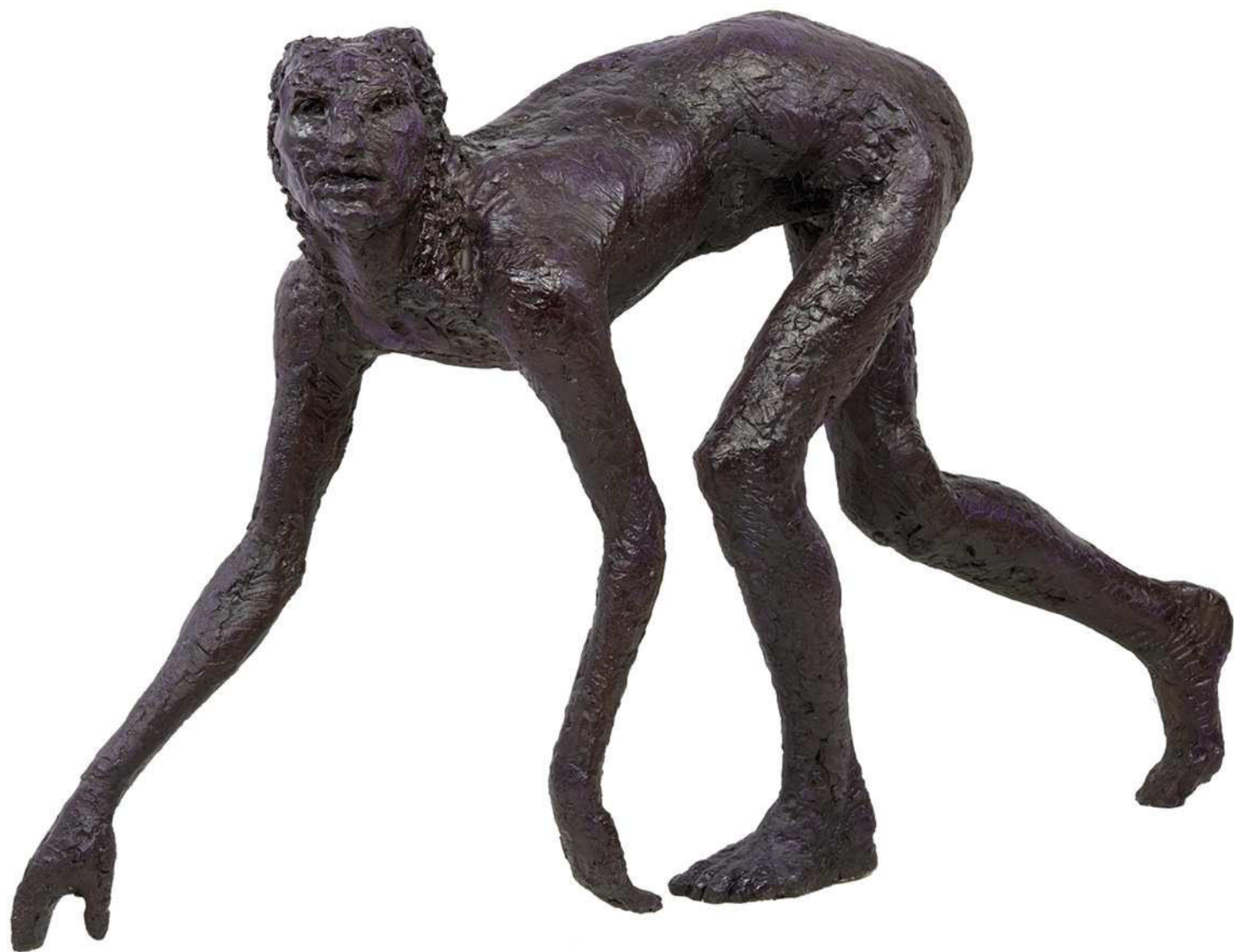
Frau, 2019 Kunstharz bemalt 143 / 40 / 90 cm