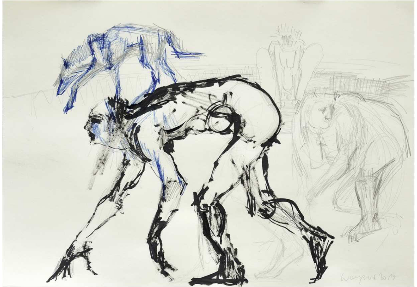
ohne Titel, 2019 Mischtechnik auf Papier 50 / 70 cm