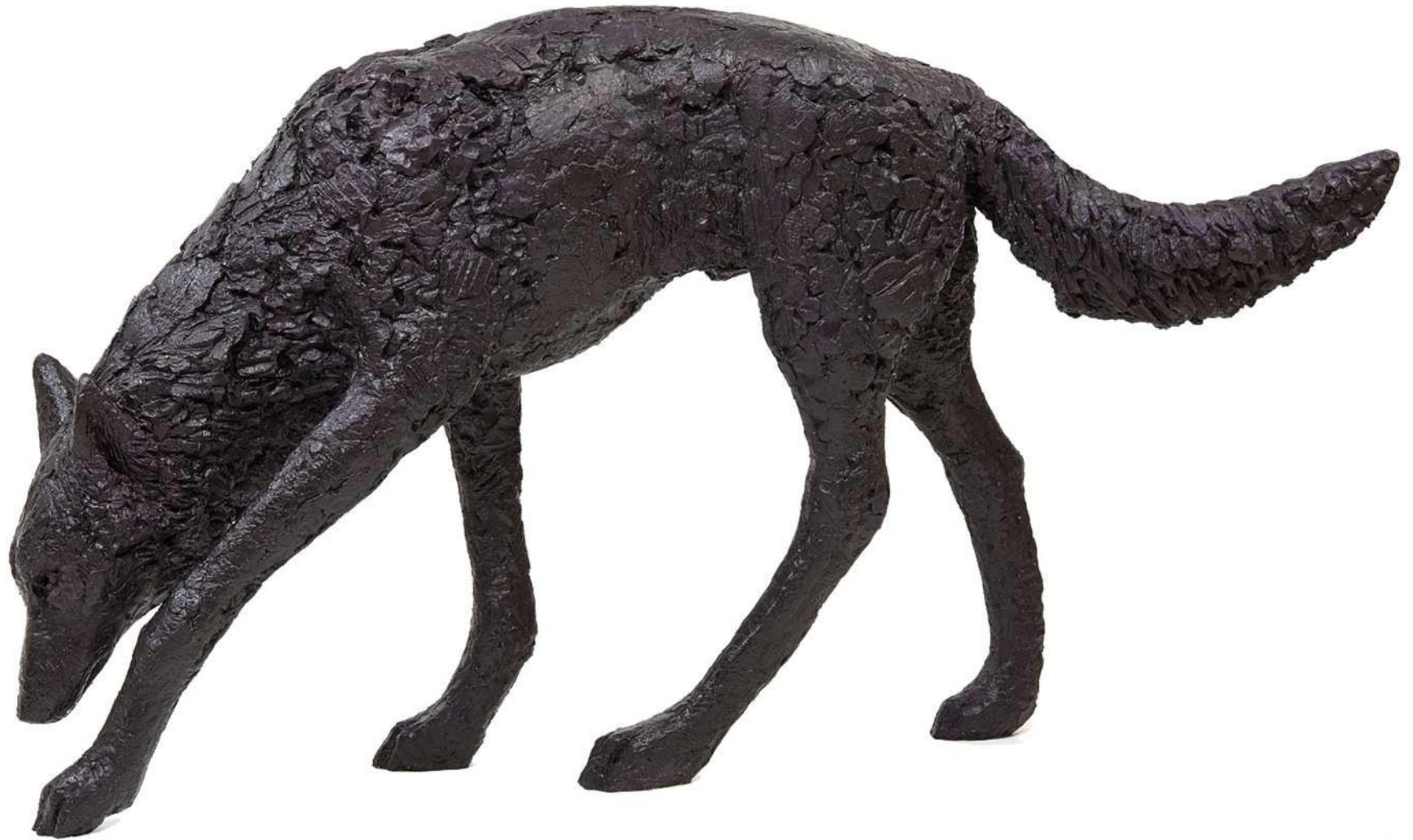
Wolf 3, 2019 Kunstharz bemalt 135 / 28 / 77 cm