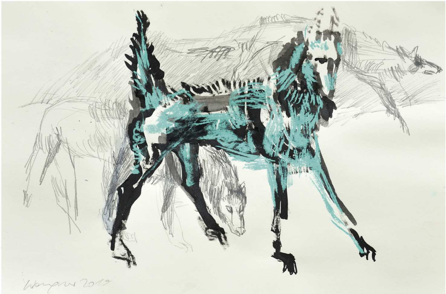
ohne Titel, 2019 Mischtechnik auf Papier 50 / 70 cm