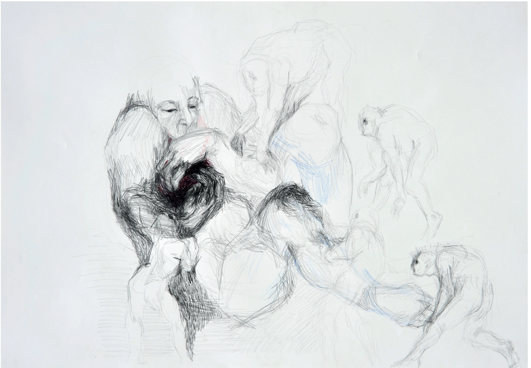
ohne Titel, 2013 Bleistift und Buntstift auf Papier 70 / 100 cm