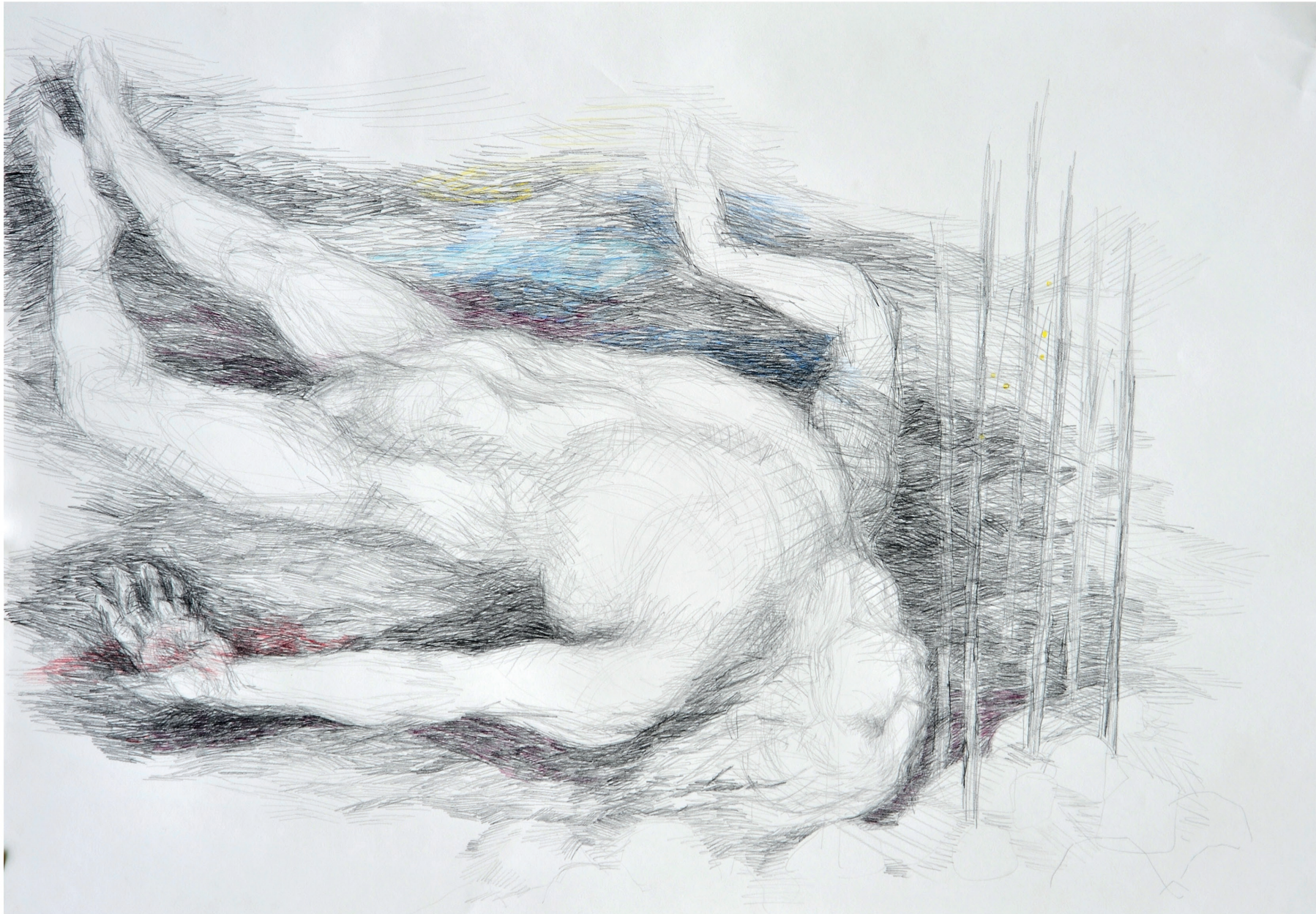
ohne Titel, 2013 Bleistift und Buntstift auf Papier 70 / 100 cm