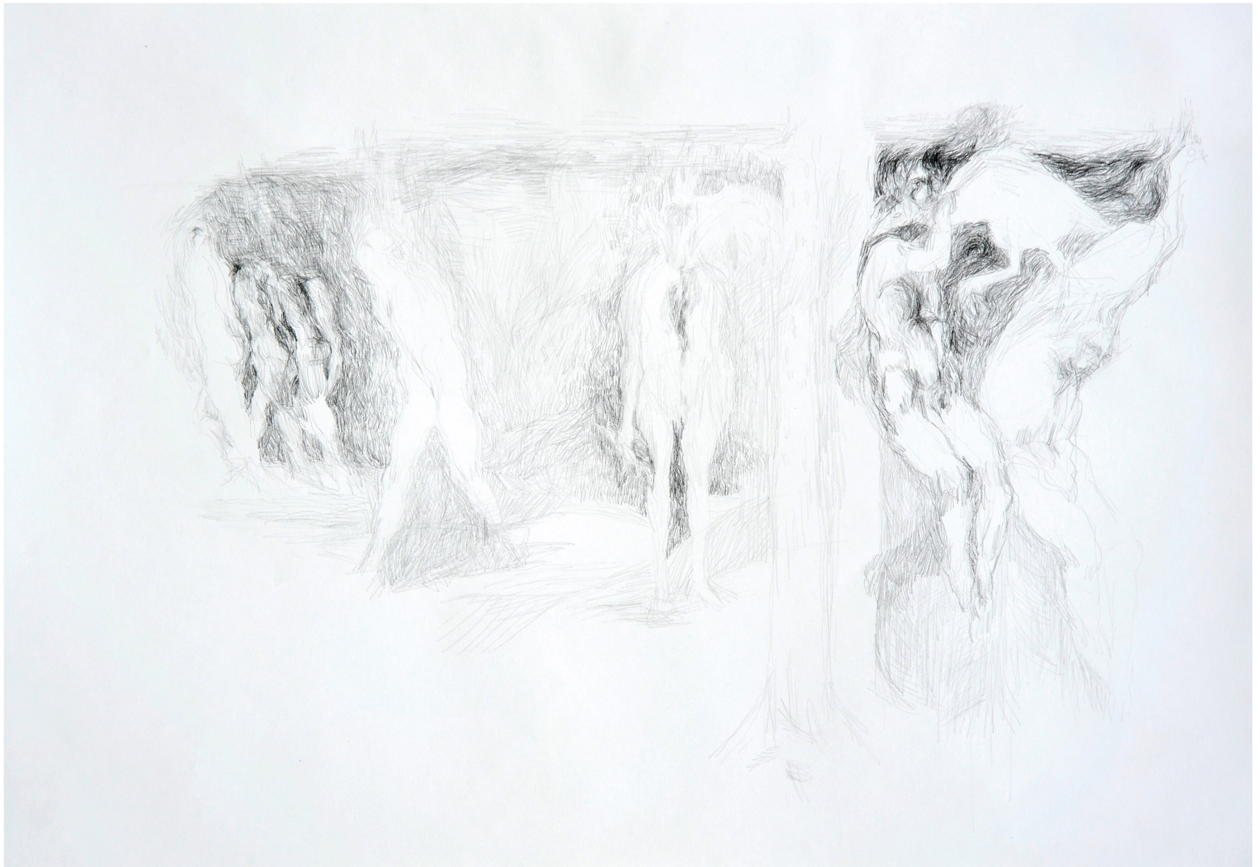
ohne Titel, 2013 Bleistift auf Papier 70 / 100 cm