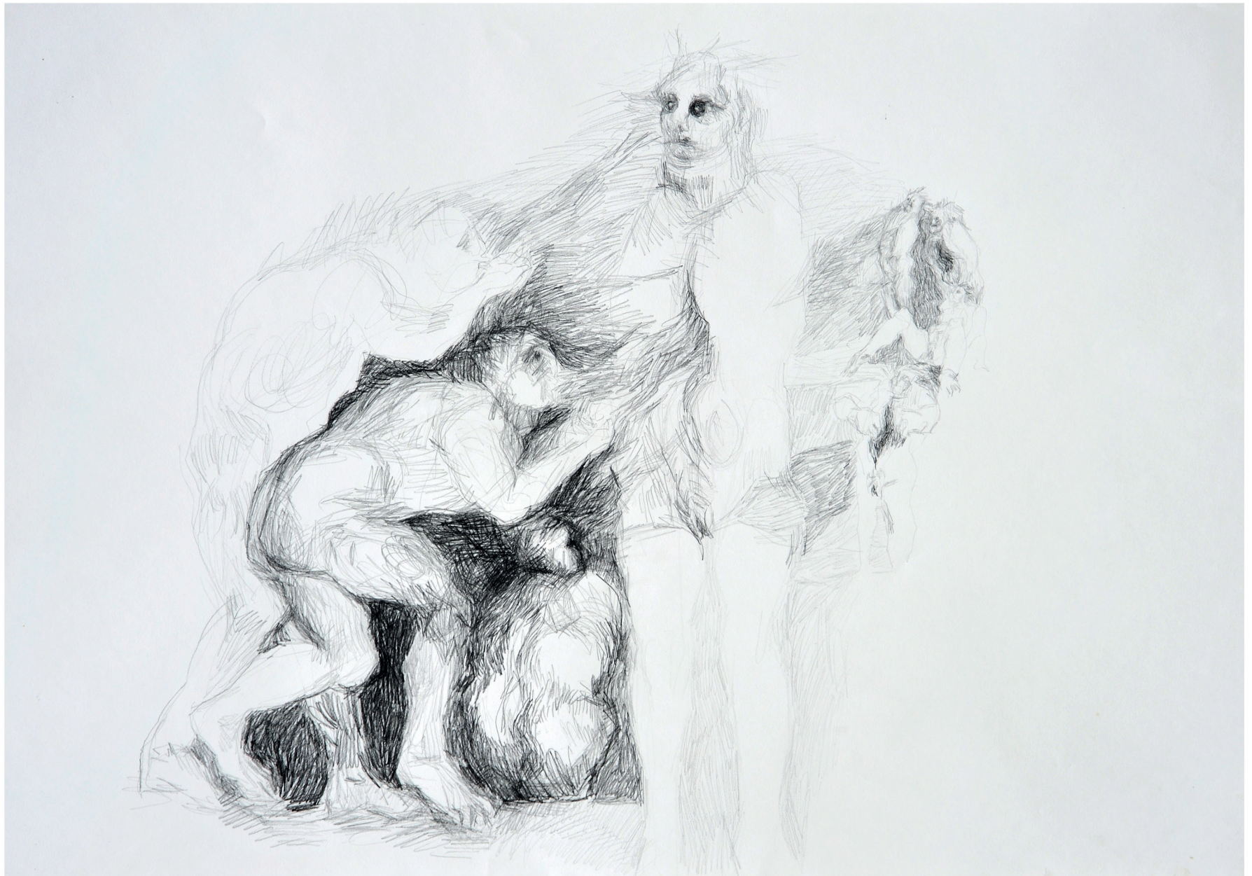
ohne Titel, 2013 Bleistift auf Papier 70 / 100 cm