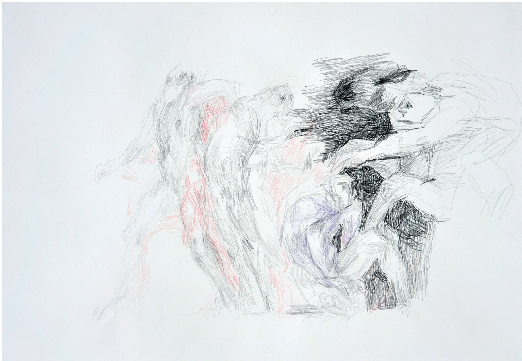
ohne Titel, 2013 Bleistift und Buntstift auf Papier 70 / 100 cm