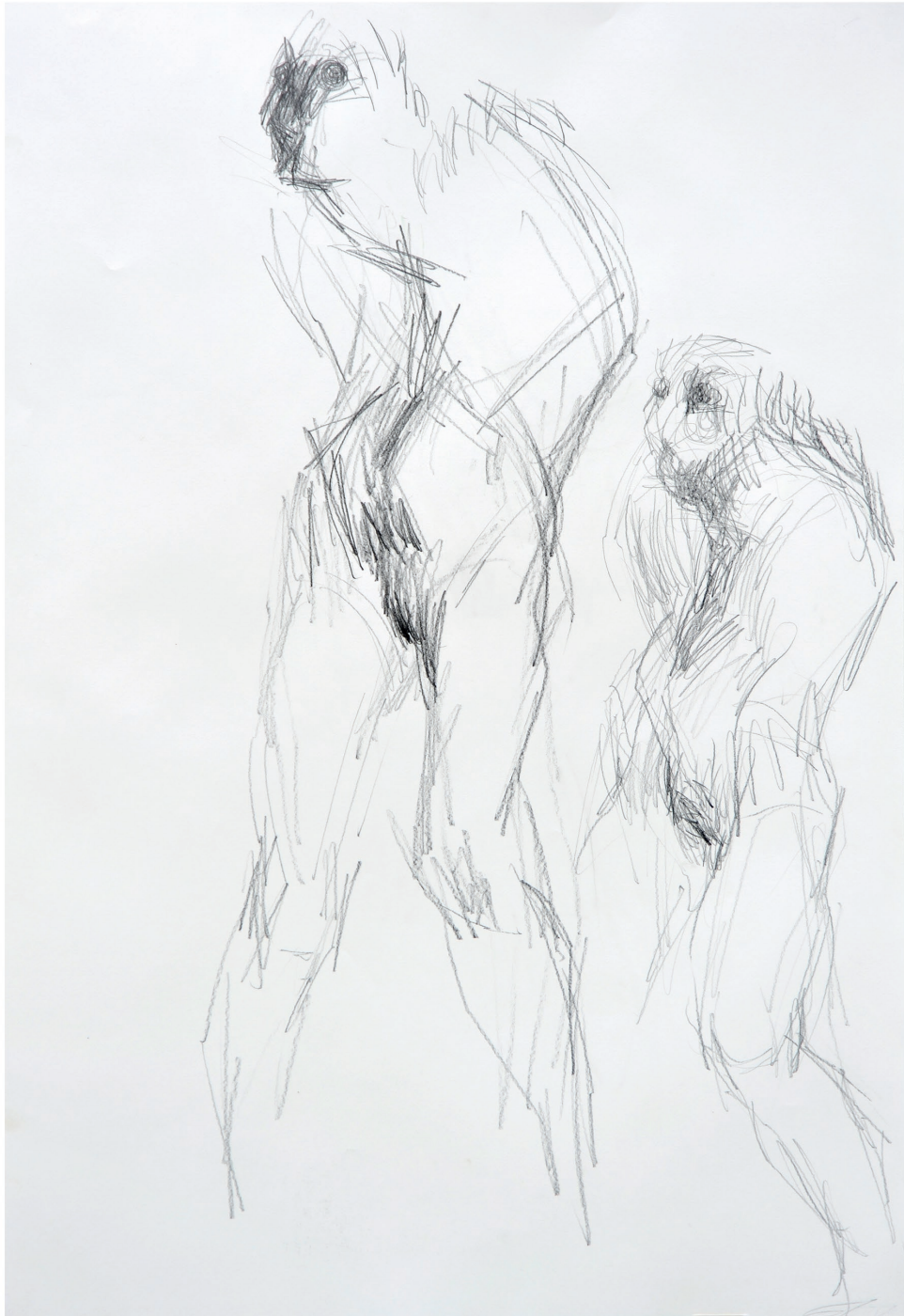
ohne Titel, 2013 Bleistift auf Papier 70 / 100 cm