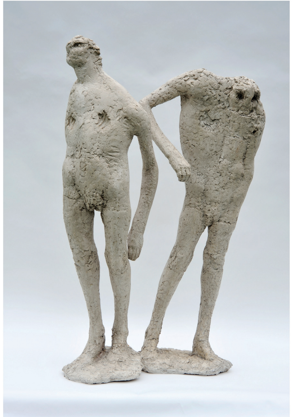
inside/outside, 2013 Gips bemalt Figur I 136 / 57 / 34 cm Figur II 141 / 37 / 43 cm