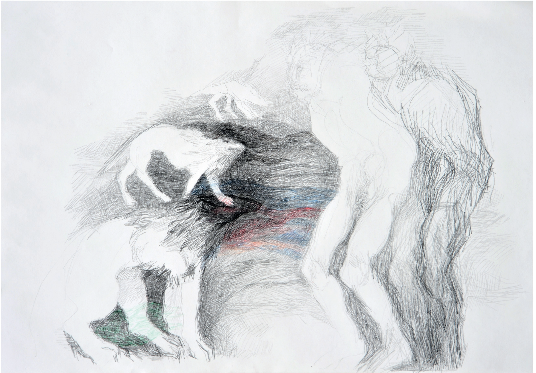
ohne Titel, 2013 Bleistift und Buntstift auf Papier 70 / 100 cm