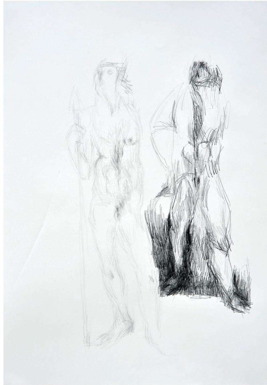
ohne Titel, 2013 Bleistift auf Papier 70 / 100 cm