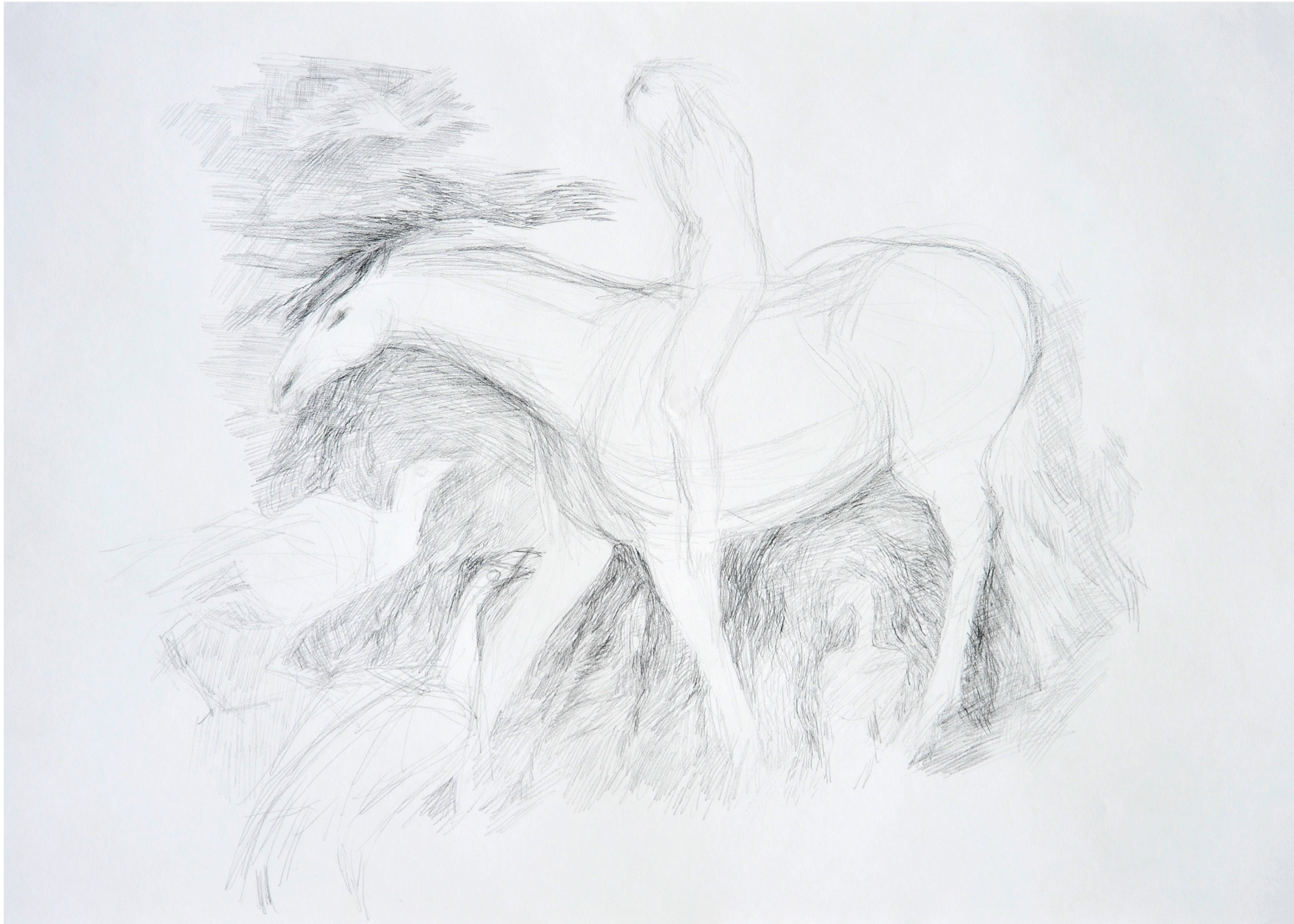
ohne Titel, 2013 Bleistift und Buntstift auf Papier 70 / 100 cm