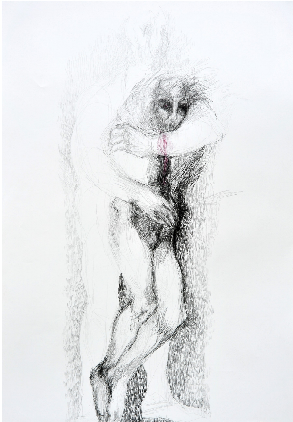
ohne Titel, 2013 Bleistift und Buntstift auf Papier 70 / 100 cm