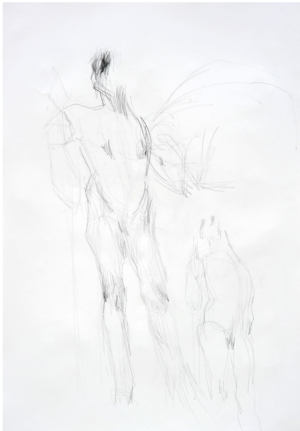
ohne Titel, 2013 Bleistift auf Papier 70 / 100 cm