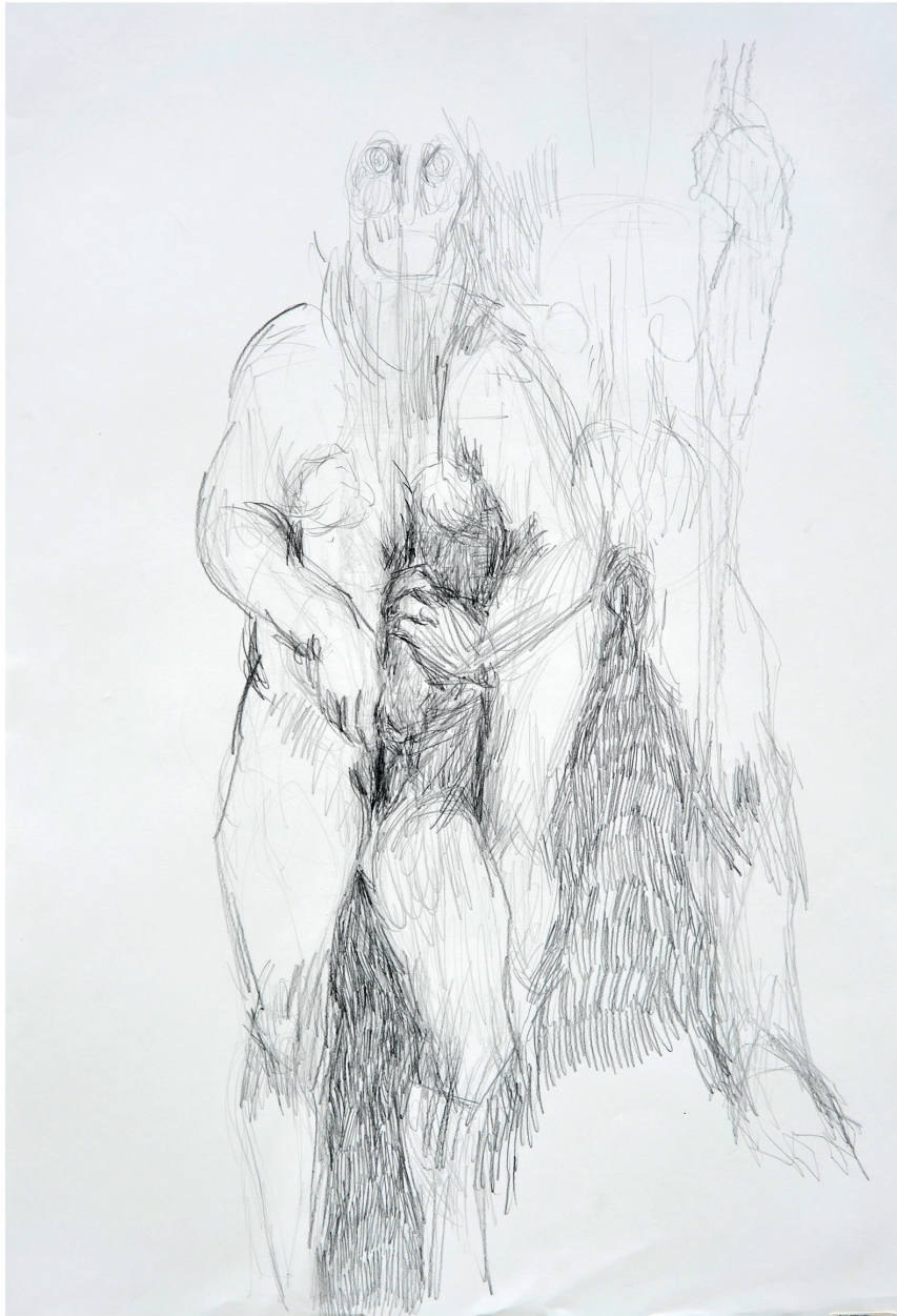
ohne Titel, 2013 Bleistift auf Papier 70 / 100 cm