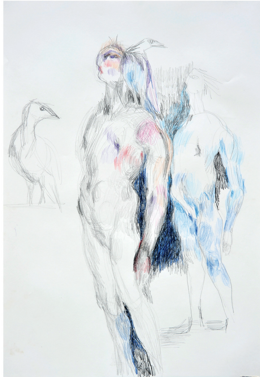
ohne Titel, 2013 Bleistift und Buntstift auf Papier 70 / 100 cm