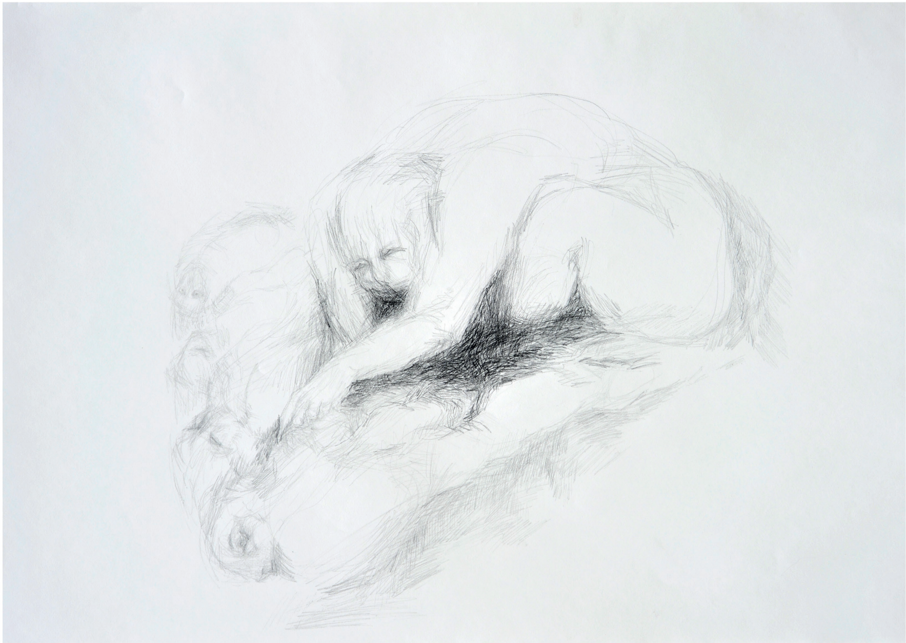
ohne Titel, 2013 Bleistift auf Papier 70 / 100 cm