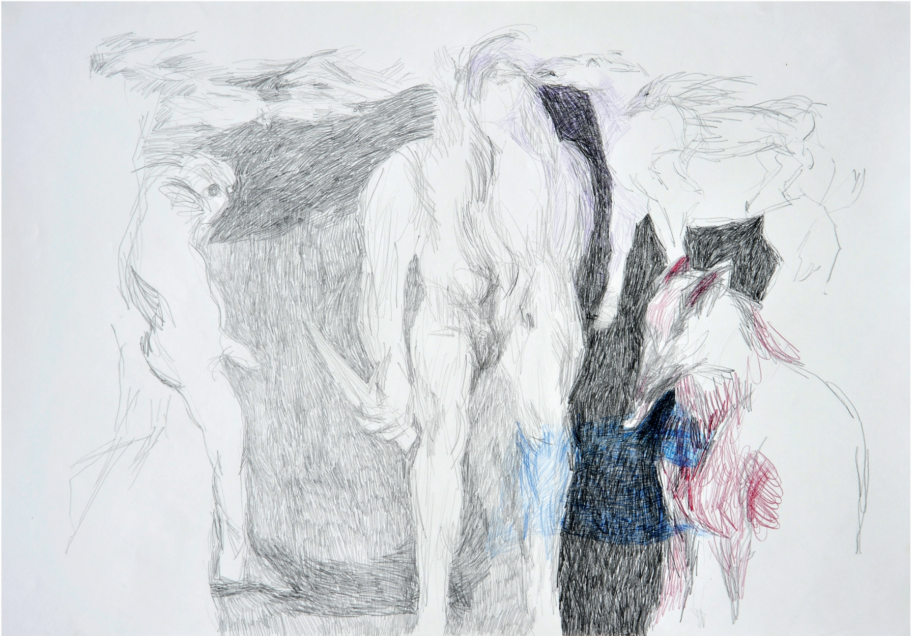
ohne Titel, 2013 Bleistift und Buntstift auf Papier 70 / 100 cm