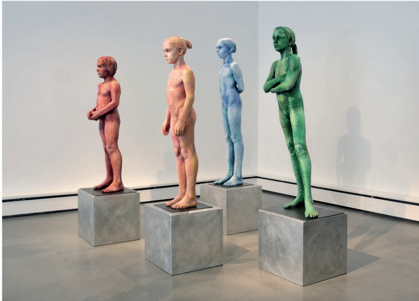
Installation 180 / 250 / 202 cm